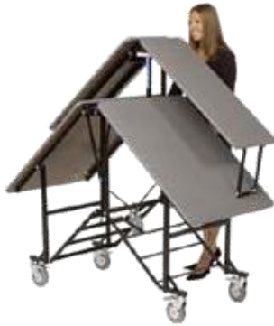
schneller, einfacher Aufbau